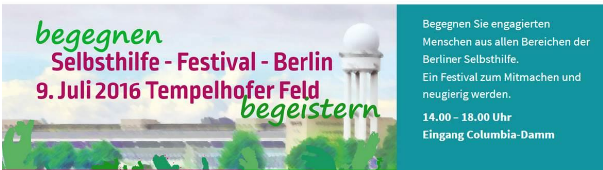
Abb.: Flyer Selbsthilfe-Festival. Grafik LV Selbsthilfe Berlin.

Alle zwei Jahre wird aus dem Berliner Selbsthilfetag der LV Selbsthilfe Berlin ein Festival. Und wie immer präsentierte sich ACHSE mit einem Stand. Informieren, beraten, netzwerken und Gesicht zeigen – das waren die Aufgaben der vier ACHSE-Freiwilligen an diesem Sommertag. Nicht fehlen durften die unzähligen roten ACHSE-Ballons, die für Auflockerung und noch mehr Sichtbarkeit der ACHSE sorgten.