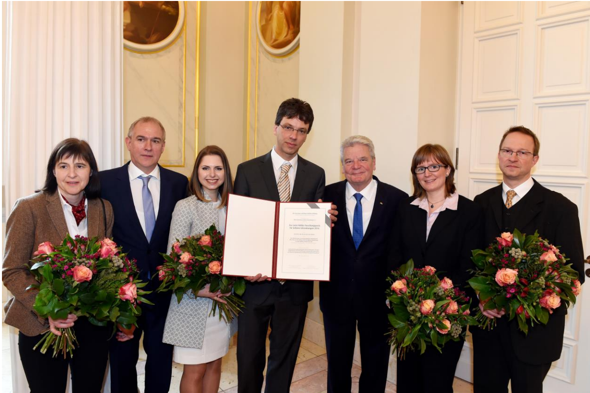
Forschungspreis 2016 – Das gewürdigte Forscherteam mit Bundespräsident Joachim Gauck.