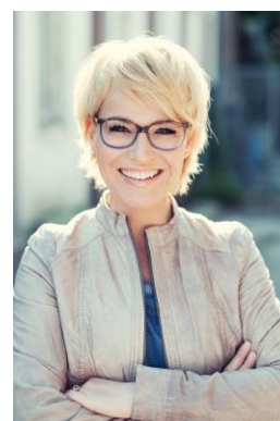
Andrea Ballschuh, Botschafterin der ACHSE.

Andrea Ballschuh, Moderatorin, Autorin und Sprecherin, konnte zum Ende des Jahres als ACHSE-Botschafterin gewonnen werden. Die beliebte Fernsehmoderatorin beendete Mitte Dezember nach 13 Jahren ihre Moderatorentätigkeit für das bunte Service-Magazin „Volle Kanne“ im ZDF und widmet sich seit Dezember 2016 als ACHSE-Botschafterin den Waisen der Medizin, einem Thema, das ihr sehr am Herzen liegt.