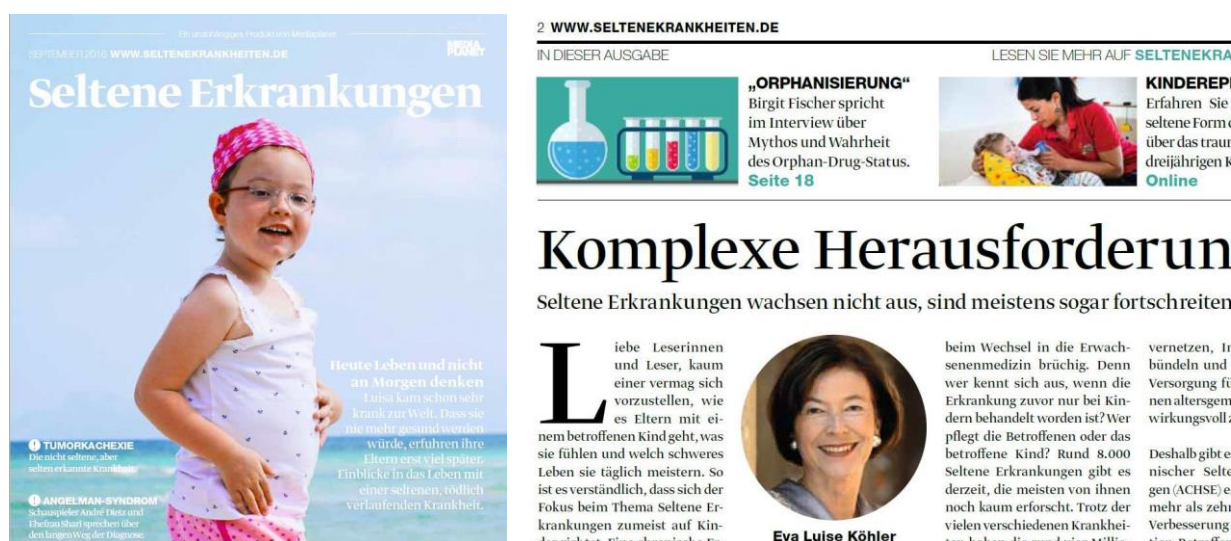
Abb.: Cover Magazin „Seltene Erkrankungen“ und daraus Abb. Vorwort Eva Luise Köhler. Ausgabe Sept. 2016

In bewährter Zusammenarbeit mit dem Verlagshaus „Mediaplanet“ wurden zwei Sonderbeilagen „Seltene Erkrankungen“ veröffentlicht: In der Tageszeitung „Die Welt“ (Februar) mit einer Reichweite von 680.000 und im Magazin „Der Spiegel“ (September) mit einer Reichweite von ca. 3 Millionen. Gleichzeitig wurden wieder alle Inhalte auf der eigens vom Verlag implementierten Webseite www.seltenkrankheiten.de veröffentlicht und in den jeweiligen Social-Media-Kanälen von „Mediaplanet“ bzw. auf der ACHSE-Facebook-Seite beworben. Die Sonderbeilagen werden über ihr Erscheinungsdatum hinaus auf Veranstaltungen, wie denen zum Tag der Seltene Erkrankungen, verteilt.