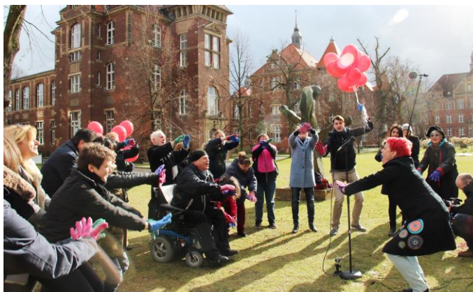
Bunte ACHSE-Aktion zum Tag der Seltenen.

Gemeinsam mit starken Botschaftern aus unseren Mitgliedsreihen packten wir unsere Forderungen in eine musikalische Aktion mit Augenzwinkern und Spaßfaktor. Möglich wurde das auch durch das DRK Klinikum Berlin | Westend sowie der DRK Schwesternschaft, die uns auf dem Klinikgelände gewähren ließen und mitmachten.