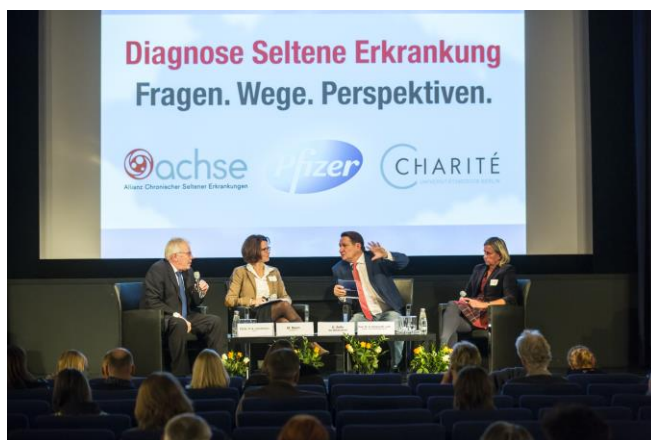
Podiumsdiskussion in der Urania.

Was es bedeutet mit einer Seltene Erkrankung zu leben, wie die aktuelle Versorgungslage der Betroffenen in Deutschland ist und wo Patienten und Angehörige Hilfe finden – darum ging es auf der gemeinsamen Veranstaltung „Diagnose Seltene Erkrankung – Fragen. Wege. Perspektiven.“ von ACHSE, der Charité-Universitätsmedizin Berlin und dem Unternehmen Pfizer am 3. November 2016 in der Urania (Berlin).