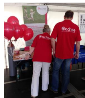
Teamvertreter am ACHSE-Stand.

Alle zwei Jahre wird aus dem Berliner Selbsthilfetag der LV Selbsthilfe Berlin ein Festival. Und wie immer präsentierte sich ACHSE mit einem Stand. Informieren, beraten, netzwerken und Gesicht zeigen – das waren die Aufgaben der vier ACHSE-Freiwilligen an diesem Sommertag. Nicht fehlen durften die unzähligen roten ACHSE-Ballons, die für Auflockerung und noch mehr Sichtbarkeit der ACHSE sorgten.