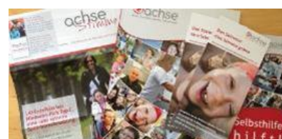
Abb.: Auswahl ACHSE-Publikationen.

Aus der „ACHSE Stimme“ erfahren Freunde und Förderer: Wer sind die Seltenen? Mit welchen Problemen und Herausforderungen sind sie konfrontiert? Die Publikation hat im Juni und November rund 4000 Kontakte erreicht.