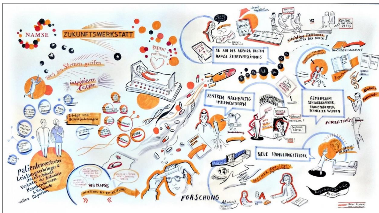
Abb.: Grafisches Protokoll entstanden bei der NAMSE-Zukunftswerkstatt. Grafik NAMSE.

Die Beratungen im Workshop wurden von einer Zeichnerin protokolliert: