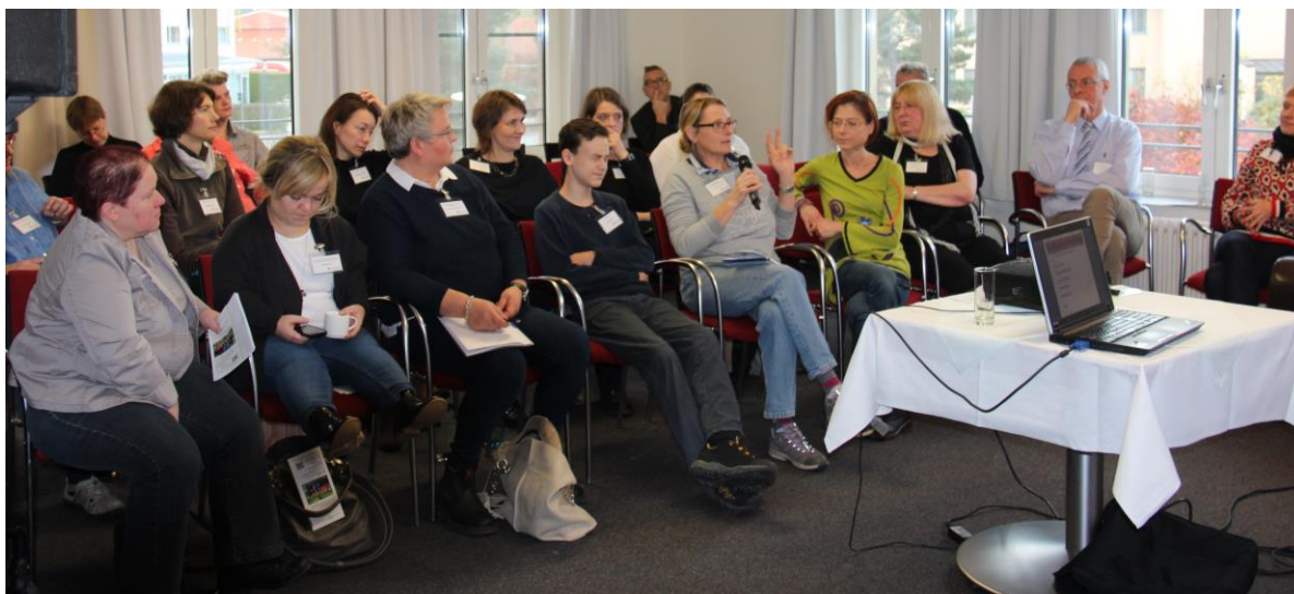
Angeregte Gruppendiskussion im Workshop „Erwachsen werden“ am 19.11.2016.

Tenor der vielfältigen Beiträge aus den Selbsthilfeorganisationen war, dass der Generationenwechsel viele Hürden birgt: Seien es die unterschiedlichen Ansichten von Jung und Alt, die Art Dinge anzupacken oder aber überhaupt junge Betroffene zu finden, die sich mit Herzblut engagieren wollen. Ein Generationenwechsel muss nicht bedeuten, dass ein neuer jüngerer Vorstand den alten überflüssig macht. Die Expertise der erfahrenen Vorgänger ist wertvoll und sollte weiter genutzt werden, z.B. in einer Beraterfunktion oder als Ehrenvorsitz. Die Hemmschwelle, selbst Vorstandsmitglied zu werden, kann durch die Verteilung der Arbeitspakete auf verschiedene Schultern verringert werden. Externe Berater können zum Thema Organisationsentwicklung zu Rate gezogen werden. Auf jeden Fall ist ein Generationenwechsel nicht von heute auf morgen durchzuführen und benötigt eine lange Vorbereitungszeit. Man muss loslassen können und sich mit gegenseitigem Respekt begegnen.