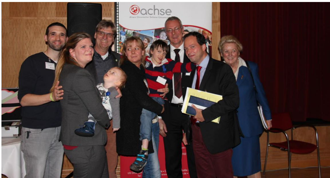
Neues Mitglied Tay-Sachs und Morbus Sandhoff mit Vertretern des ACHSE-Vorstandes.